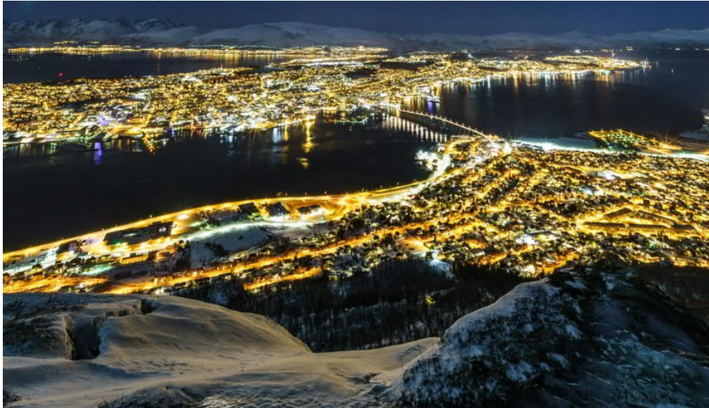
Tromsø in Norwegen, Ausrichter für das Jahr 2027