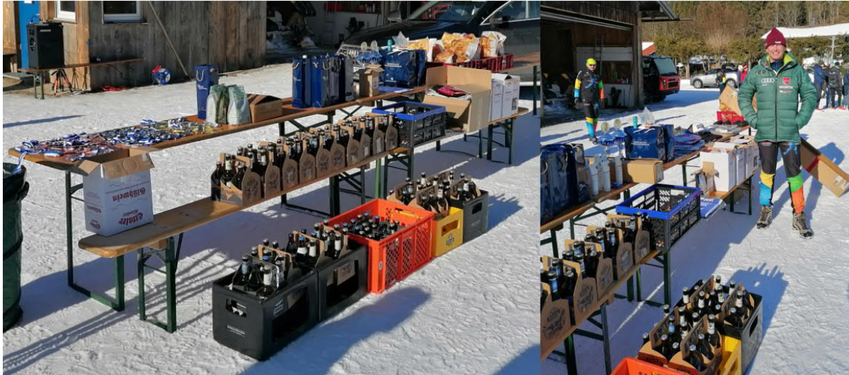
Preise für die Siegerehrungen BM und DM Tag 2

Insgesamt gaben für den ersten Renntag 54 Teilnehmer ihre Meldungen ab, 5 Teilnehmer erschienen nicht zum Start und eine Aufgabe war zu verzeichnen, sodass nur 48 Teilnehmer in die Wertung gelangten.