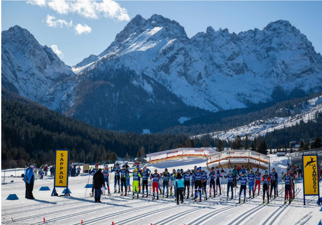
Startzone Skistadion Sappada vor einer traumhaften Kulisse der Dolomiten