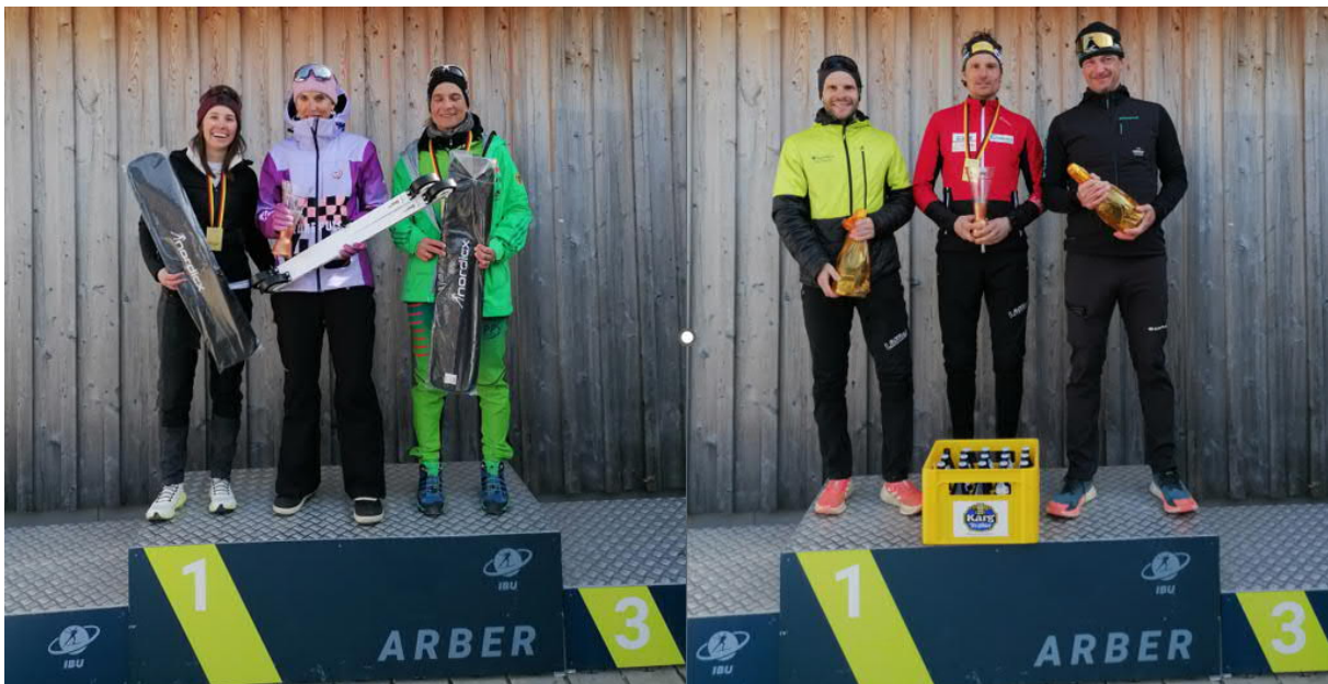
Siegerehrung Damen und Herren Masters Gesamtwertung

Die DM konnte nach den Vereinsstaffelrennen als eine gute Veranstaltung gesehen werden. Das Ziel sollte sein, dass die Masters daran auch weiter teilnehmen, auch wenn die Saison sehr lange ist und die Strecken nicht gerade die leichtesten sind. Aber auch beim Masters World Cup erwarten uns oft schwere Strecken und harte Anstiege.