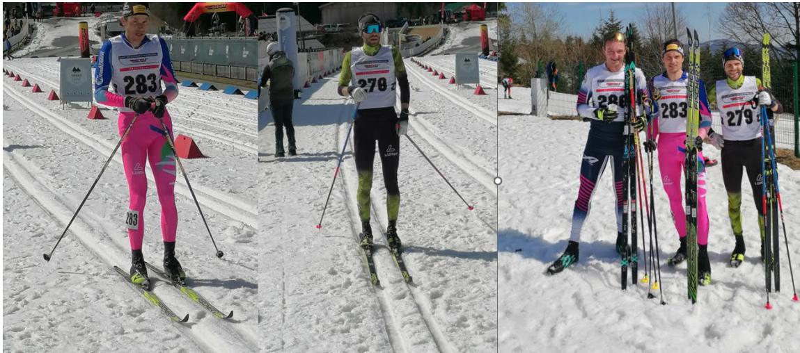
Die Sieger beim Zieleinlauf der Herren