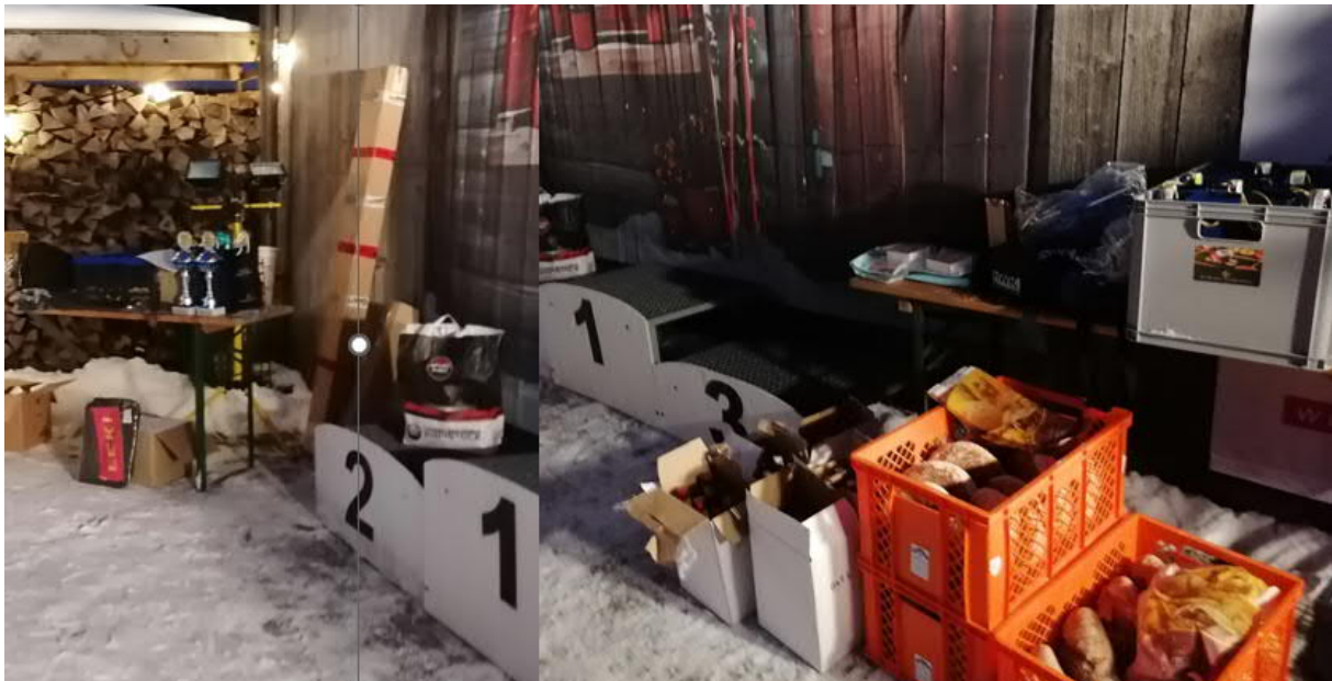
Preise für die Siegerehrungen BM und DM Tag 1