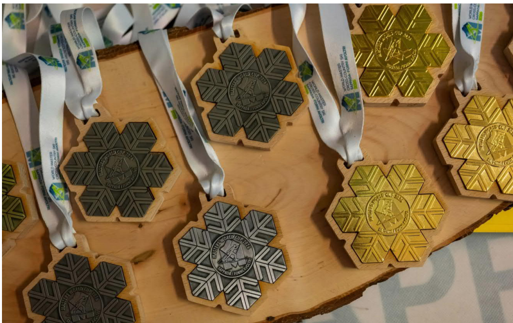
Medallienauswahl für die Sieger