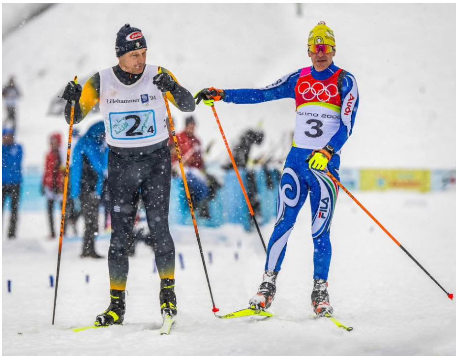
Übergabe von Pietro Piller Cottrer an Silvio Fauner

Die Olympiasieger Silvio Fauner und Pietro Piller Cottrer sowie weitere Größen des italienischen Skilanglaufs haben uns eine schöne tolle Rennwoche im Heimatort von