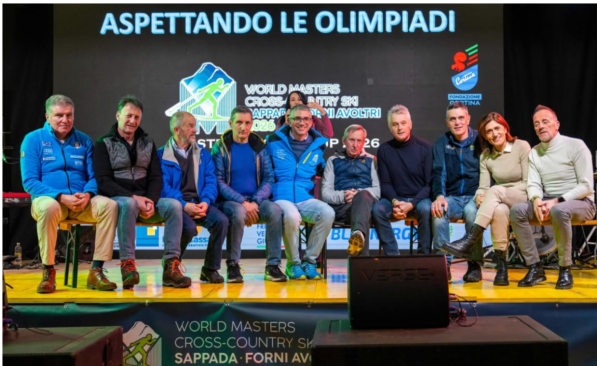
Die italienischen Olympialegenden in Sappada mit auf der Bühne

Andreas Dillmuth, Burgstraße 73, 82467 Garmisch-Partenkirchen Tel.: 0172-6612941, E-Mail: andreas.dillmuth@gmail.com